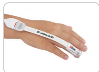
Pdt applicazione su dito