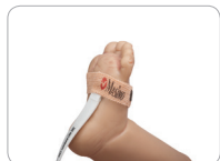
Neo applicazione su piede neonatale