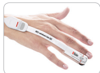
Adt applicazione su dito