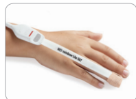
Inf applicazione su dito