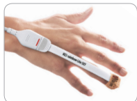
Neo applicazione su dito di adulto