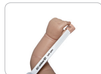
Inf applicazione su pollice